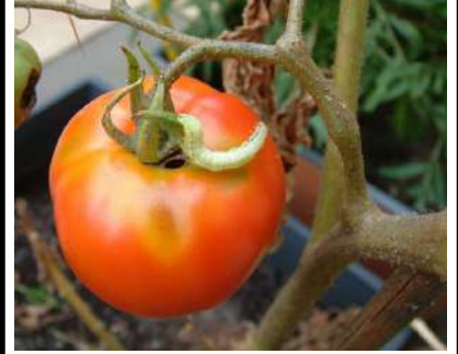
دودة ثمار الطماطم