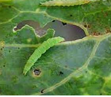
دودة الاوراق الخضراء