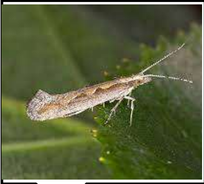
الفراشة ذات الظهر الماسي