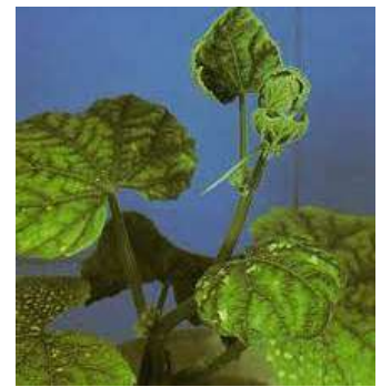
نقص الكالسيوم في الخيار