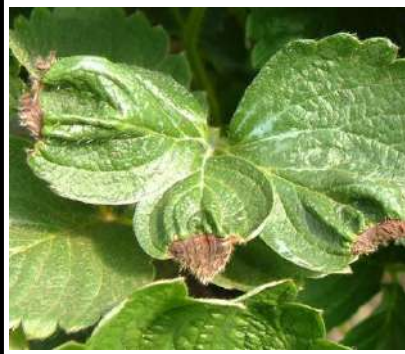
نقص الكالسيوم في الفراولة