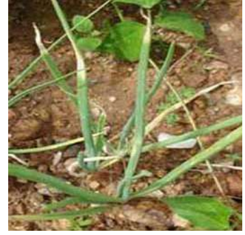
نقص الكالسيوم في البصل