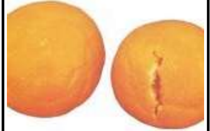
نقص الكالسيوم في الموالح