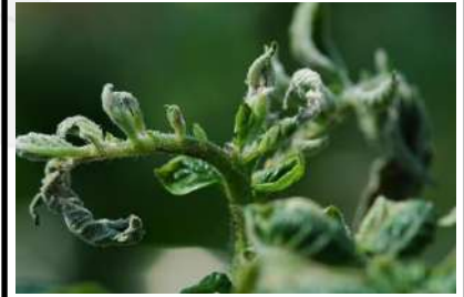
نقص الكالسيوم في البطاطس