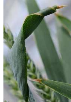
نقص الكالسيوم في القمح