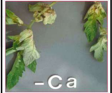
نقص الكالسيوم في الطماطم