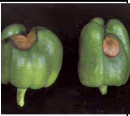
نقص الكالسيوم في الفلفل